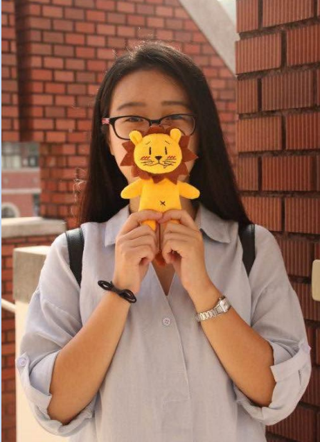
摄于大叶大学行政大楼

母校:湖洲师范学院·生物科学类专业。 就读大叶大学·生物科技暨资源学院 生物产业科技学系。